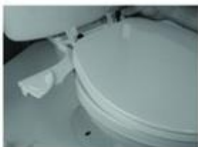
Рисунок № 6

Убедитесь в том, что кран-носик находится по центру и направлен на середину унитаза.