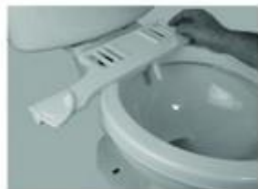
Рисунок № 5